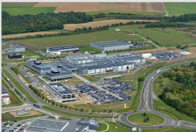
PARC D'ACTIVITE DU BOIS DE PLAISANCE